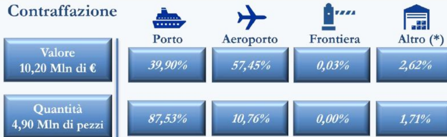
Figura II.16 - Distribuzione dei sequestri di prodotti contraffatti per tipologia di spazio doganale