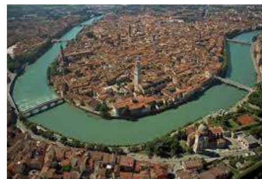
Cesare Gerolimetto - Centro storico di Verona - 2008